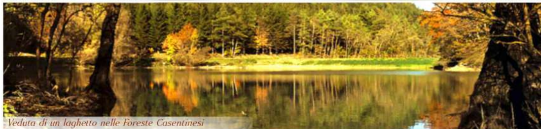
Veduta di un laghetto nelle Foreste Casentinesi