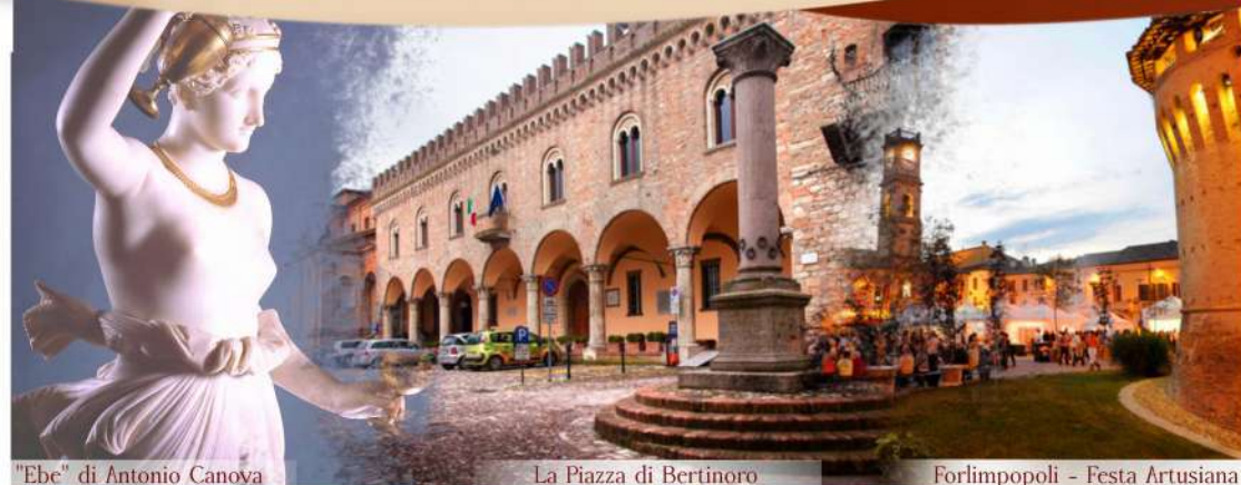
"Ebe" di Antonio Canova

A due passi dal mare e dall'Appennino, nel cuore della tradizione Romagnola