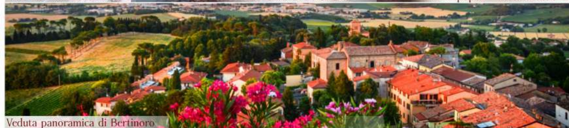
Veduta panoramica di Bertinoro