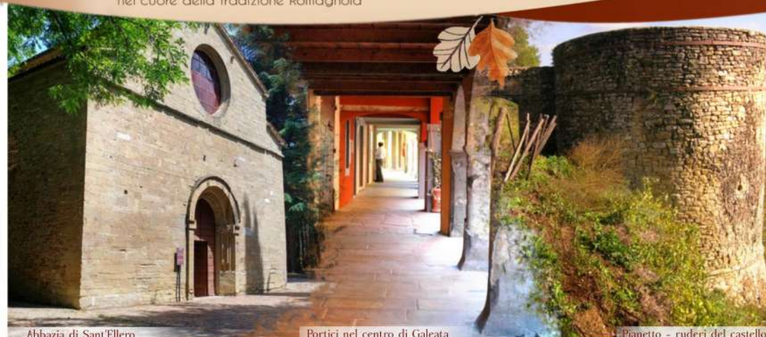
Abbazia di Sant'Ellero

A due passi dal mare e dall'Appennino, nel cuore della tradizione Romagnola